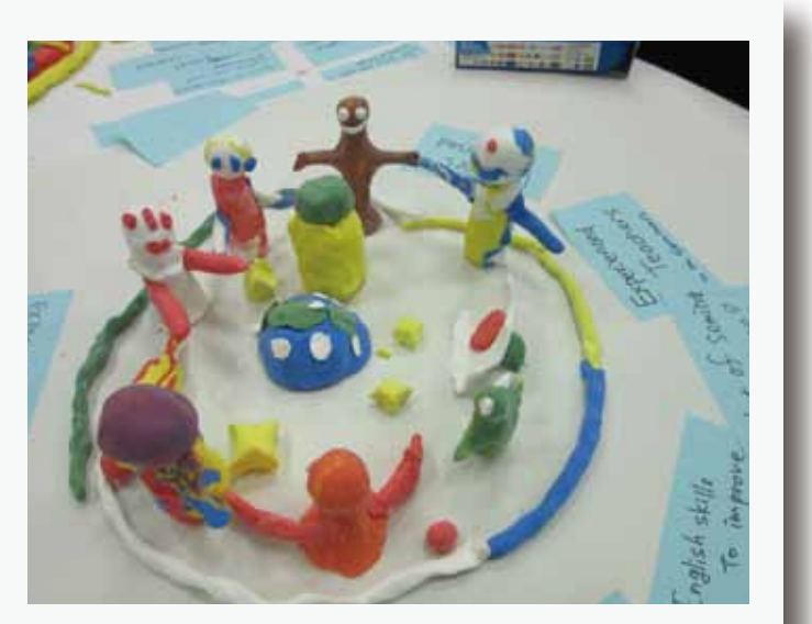
リーダーシップトレーニング講座